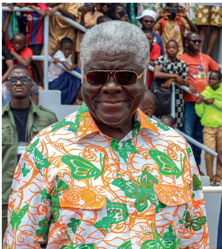
M. Beugré Mambé, 1er Ministre ivoirien, lors de la JIF 2025 08 Mars 2025, Stade de Dimbokro

En présence de Mme Dominique Ouattara, Première Dame de Côte d'Ivoire et du Chef du Gouvernement ivoirien, M. Beugré Mambé, la population de Dimbokro a répondu massivement à cette énième invitation de l'Etat de Côte d'Ivoire.