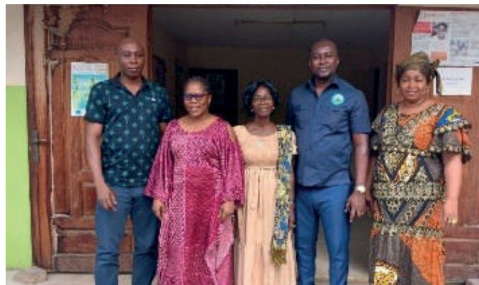
Photo de famille après la séance de travail