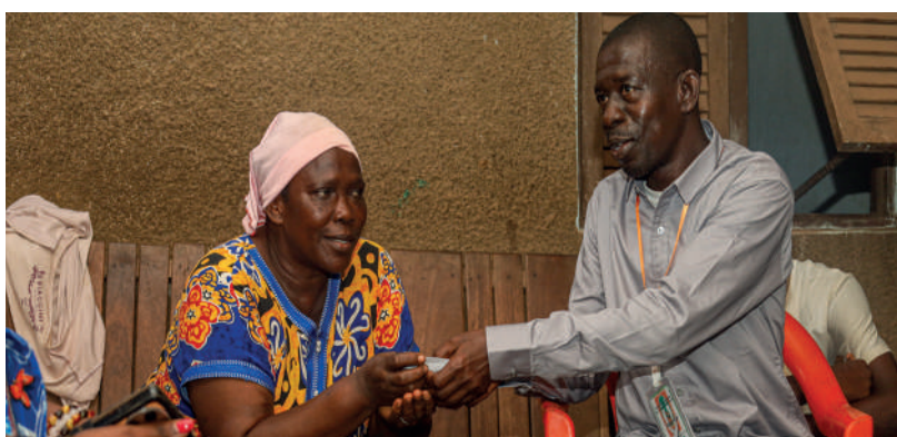
Appui du MFFE à des familles vulnérables (JIF 2025) 07 Mars 2025, Dimbokro