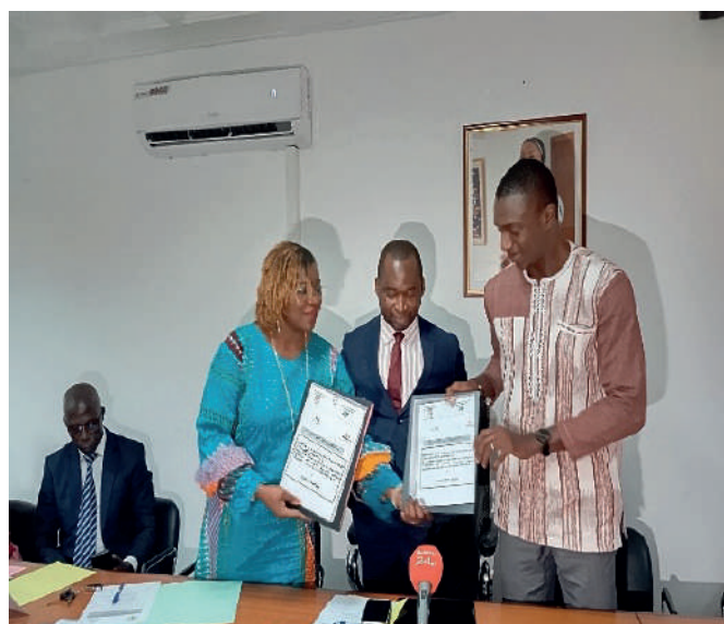
Échange de convention entre le PN-OEV et Robert's Hôtel

Cette signature a marqué une étape importante dans la collaboration entre le PN-OEV et ces structures partenaires, en raison de leur engagement commun au renforcement des interventions en faveur des OEV et du positionnement de chacune des parties.