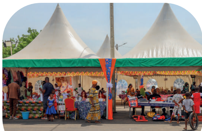
Les stands du village JIF 2025)

06 Mars 2025, terrain EPP Dioualakro de Dimbokro