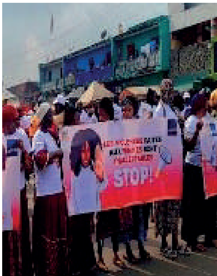
Marche organisée par le MFFE pour dire Stop aux VBG 1er Mars 2025, Abobo

Le PN-OEV ainsi que d'autres directions du MFFE, ont rejoint la marche pour dire stop aux VBG.