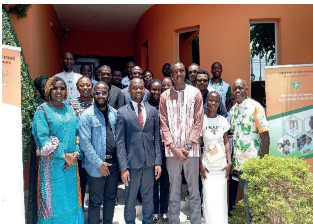
Photo de famille après la cérémonie de signature de partenariat