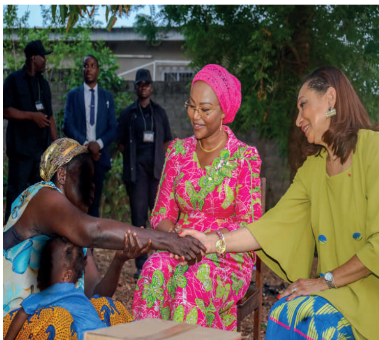
Appui du MFFE à des familles vulnérables (JIF 2025) 07 Mars 2025, Dimbokro

Le MFFE, à travers le PN-OEV, a saisi l'occasion de la célébration des droits de la femme pour venir en aide à trois familles vulnérables dans la ville de Dimbokro. En présence de Mme Nassénéba Touré, Ministre de la Femme, de la Famille et de l'Enfant et de Mme Françoise Remarck, Ministre de la Culture et de la Francophonie, ce sont des dons en vivres et non vivres que ces familles (visiblement heureuses) ont reçu.