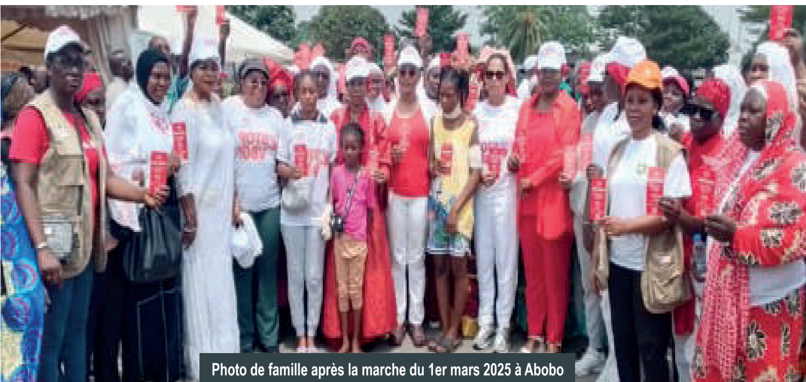
Photo de famille après la marche du 1er mars 2025 à Abobo