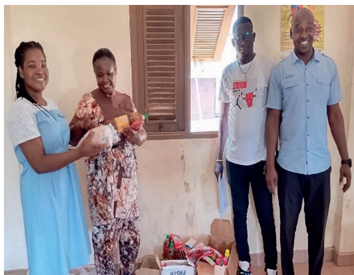
Des familles recevant leurs appuis 04 Mars 2025, Ferkéssédougou

Dans un élan de solidarité et de soutien envers les populations vulnérables, le Ministère de la Femme de la Famille et de l'Enfant (MFFE), à travers le PN-OEV a effectué la première phase de l'appui en vivres et non-vivres au titre de l'année 2025 dans les localités d'Adzopé - Abengourou - Goumeré - Boundiali - Ferkéssédougou - Dabakala - San-pédro - Buyo - Méagui. Cette activité permis de contribuer à l'amélioration de la qualité de vie de 675 Orphelins et autres Enfants rendus Vulnérables du fait du VIH/sida (OEV) et leurs familles. Un grand soulagement qui répond à certains besoins essentiels, traduisant l'engagement de l'État de Côte d'Ivoire à soutenir les couches sociales vulnérables.