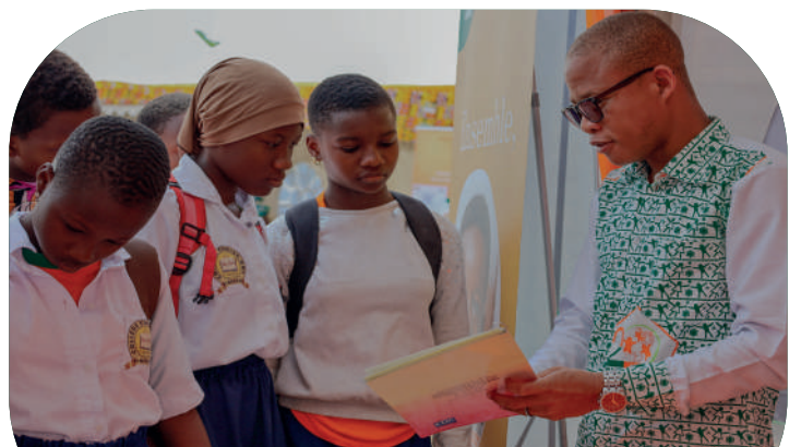
Les élèves visitent le stand du PN-OEV (JIF 2025)

06 Mars 2025, terrain EPP Dioualakro de Dimbokro