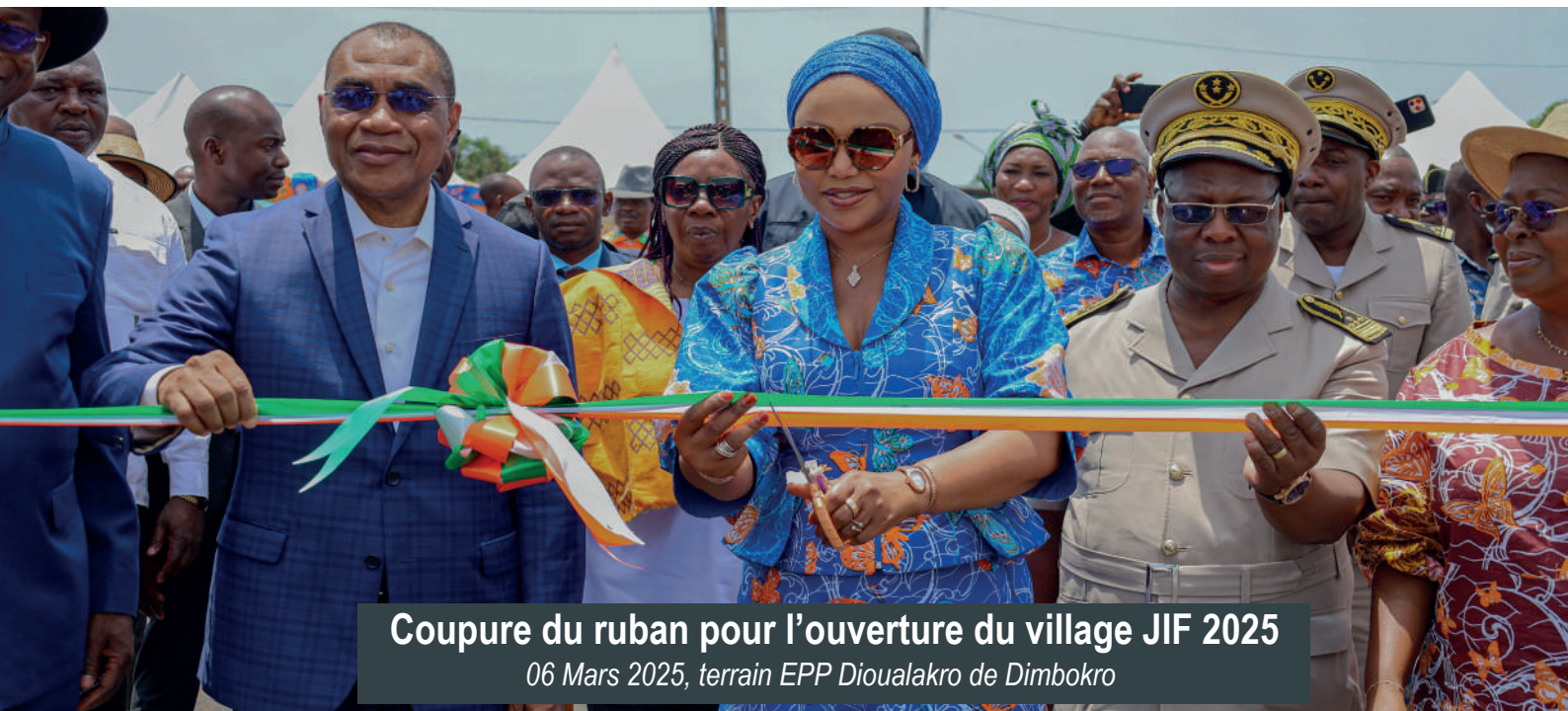
Coupure du ruban pour l'ouverture du village JIF 2025

06 Mars 2025, terrain EPP Dioualakro de Dimbokro