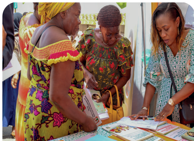
Les populations visitent le stand du PN-OEV (JIF 2025)

06 Mars 2025, terrain EPP Dioualakro de Dimbokro