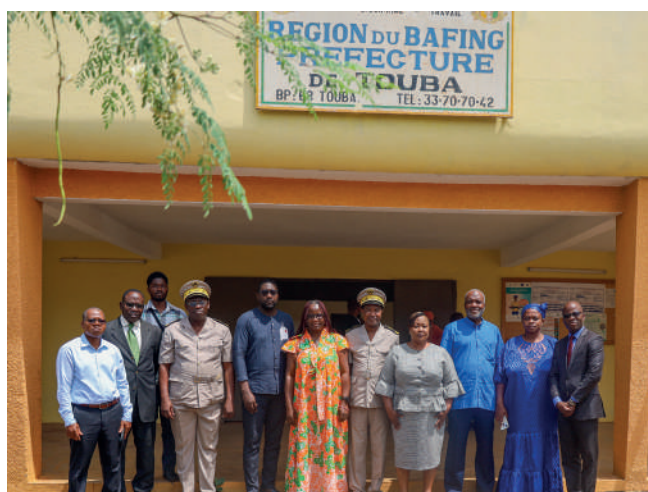
Photo de famille à la préfecture de Touba 24 Mars 2025, Touba

A cet effet, la première réunion s'est tenue du 23 au 29 mars 2025 et, sera suivie d'une mission de coaching et de supervision dans ces mêmes régions du 06 au 12 avril 2025, puis du 04 au 10 mai 2025. Toutes ces rencontres serviront de cadre au PN-OEV pour présenter les services offerts aux OEV et familles vulnérables, avec pour objectif d'engager des plaidoyers auprès de ces différentes autorités locales pour leur implication dans la coordination et la pérennisation des activités du PN-OEV.