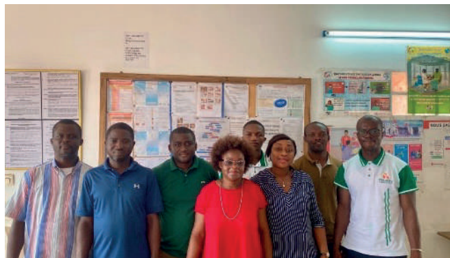
Photo de famille après la séance de travail Koumassi

L'objectif de cette mission a été d'évaluer le fonctionnement de ces centres, ainsi que des ONG partenaires, et de proposer des stratégies adaptées pour améliorer l'offre de services aux OEV et leurs familles.