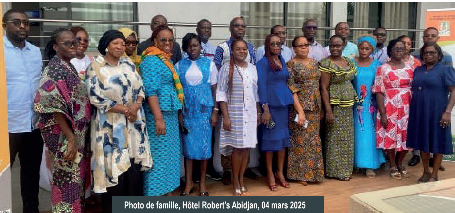
Photo de famille, Hôtel Robert's Abidjan, 04 mars 2025

Document de la Petite Enfance et Nutrition