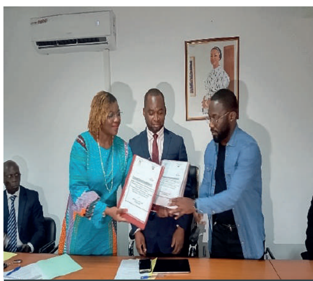
Échange de convention entre le PN-OEV et Palm Club