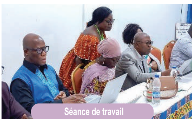
Séance de travail

Le Secrétaire Général du syndicat des formateurs de l'INFAS, a à cet effet rassuré l'équipe du PN-OEV de ce que les modules OEV avaient été pris en compte et proposé dans le curricula de formation de l'INFAS. Toutefois, lors d'un prochain atelier qui se tiendra à Yamoussoukro, l'on procédera à la validation proprement dite des différents modules OEV en vue de leur intégration