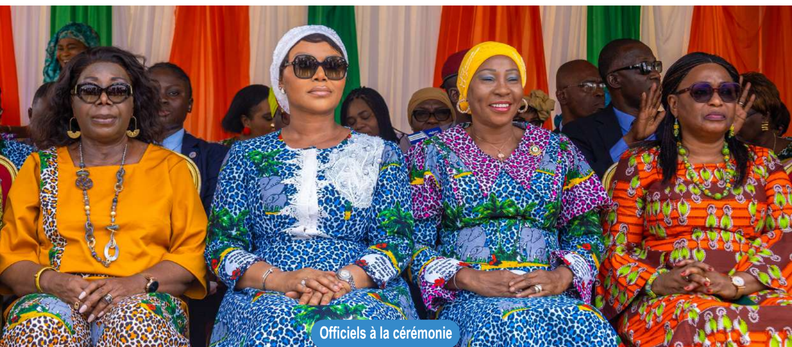
Officiels à la cérémonie

Durant trois jours, le Village JIF a initié des consultations juridiques gratuites, des actions de santé, et des sessions de renforcement des capacités à travers l'incubateur Women Power Lab, pour soutenir les initiatives économiques féminines. Ces trois jours ont permis au PN-OEV de présenter les services offerts aux OEV et de susciter l'engagement des participants dans la prise en charge des enfants vulnérables du fait du VIH/sida.