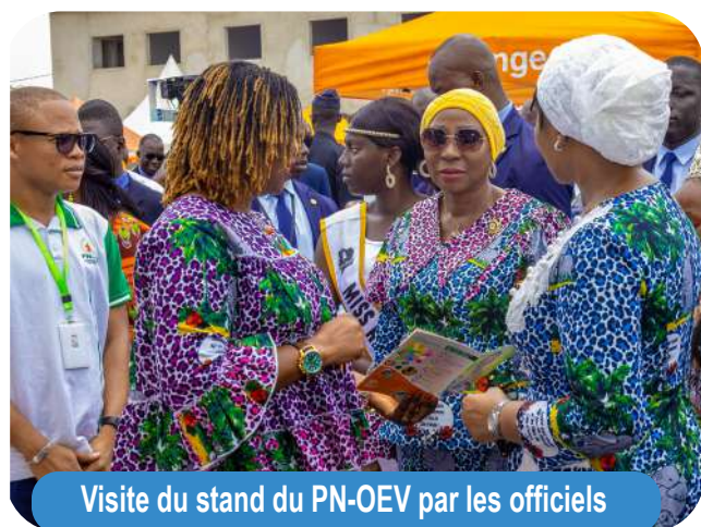
Visite du stand du PN-OEV par les officiels