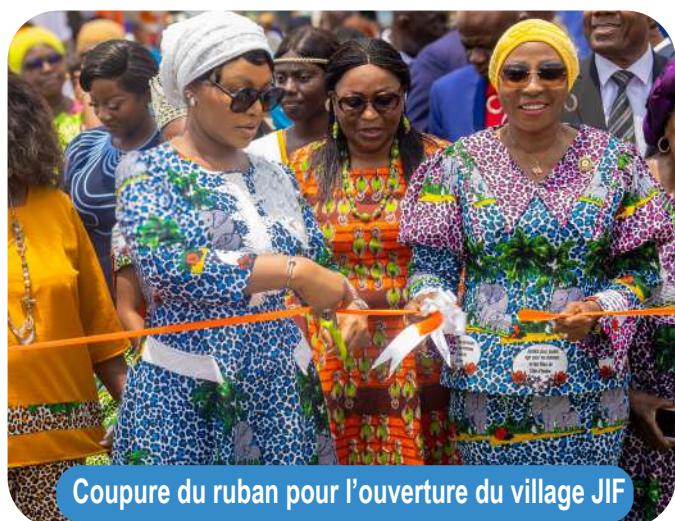
Coupe du ruban pour l'ouverture du village JIF